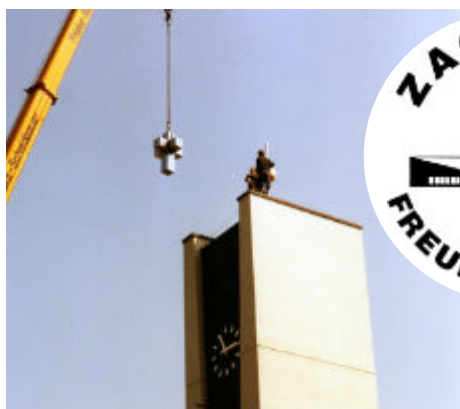
Das Kreuz auf dem Turm der Zachäuskirche wurde vom Zachäus-Freundeskreis finanziert.

Am 28. Juni 2021 wurde der Zachäus-Freundeskreis neu gegründet.