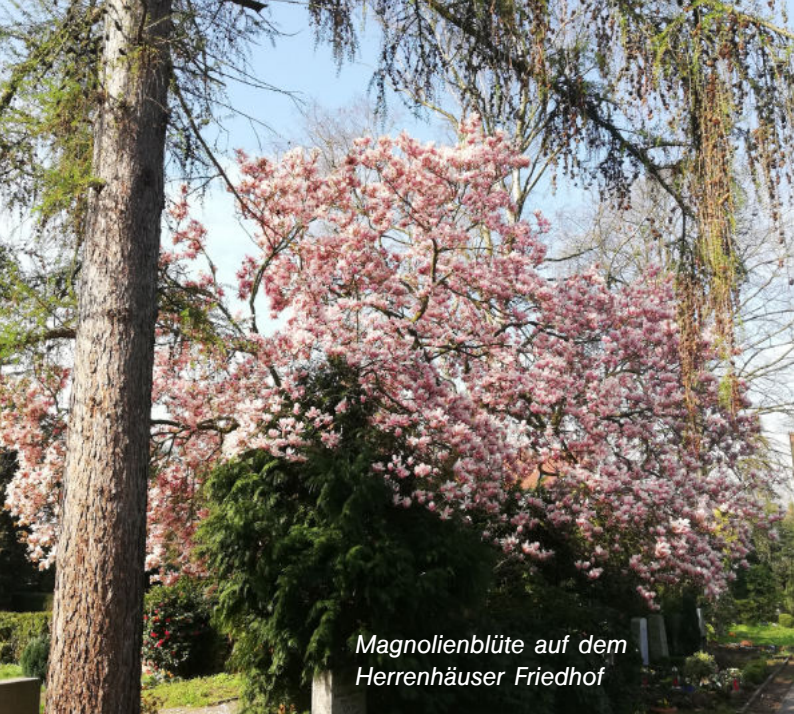
Magnolienblüte auf dem Herrenhäuser Friedhof